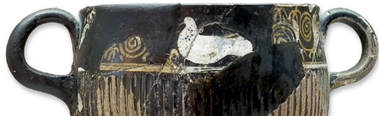
Verre de Gnathia. IIIe siècle av. J.-C

afin de réguler l'illumination et la température de l'environnement thermal. D'autres ouvertures communicatives permettaient cette même climatisation dans les salles salutaires et favorisaient les propriétés curatives de ses eaux.