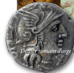
Denier romain d'argent. IIe siècle ap. J.-C.