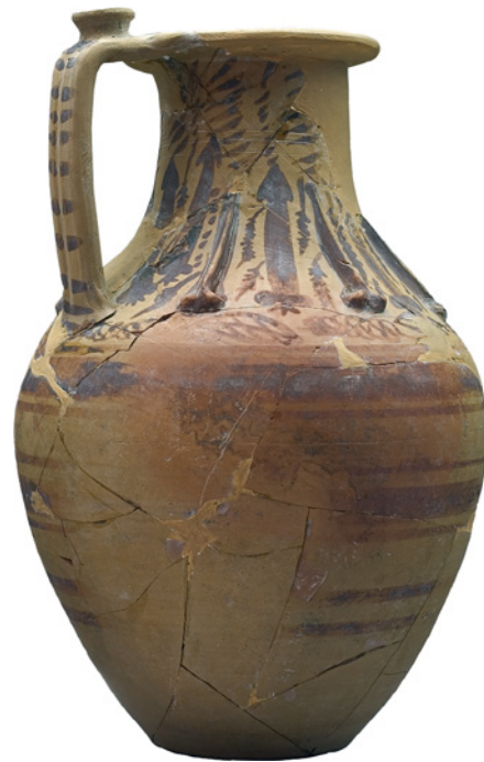
Broc romain de tradition Ibérique. II-IIIe siècles ap. J.-C

Le second espace thermal est le plus important et se compose de deux salles voûtées de grande amplitude qui constituent le centre du complexe, avec une piscine commune et des lucarnes zénithales dans chacune d'entre elles