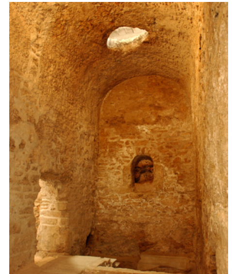
Salle voûtée pour le bain des hommes

Les thermes constituaient un des lieux de divertissement préféré des romains pour se baigner, se faire masser, bavarder, faire des exercices physiques, etc., autrement dit pour atteindre un bien être du