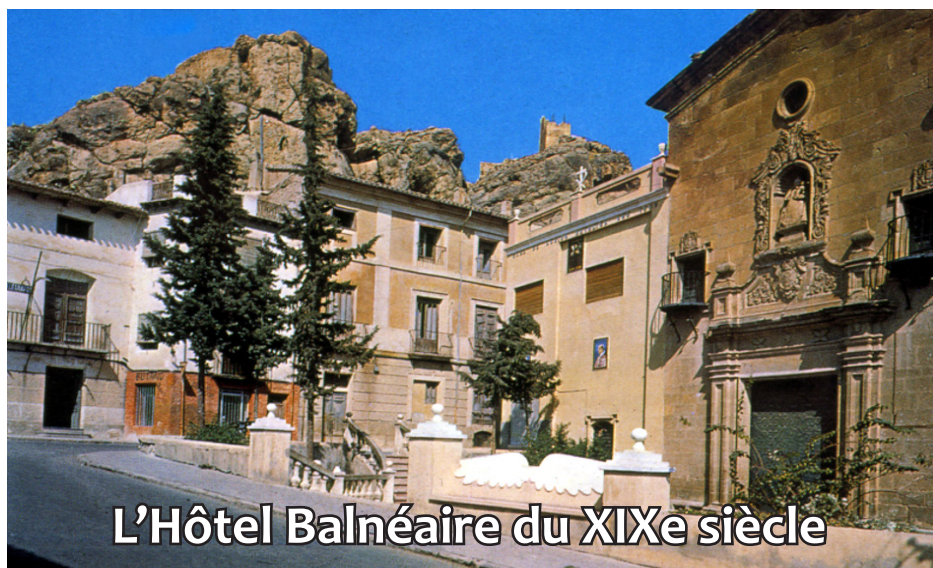
L'Hôtel Balnéaire du XIXe siècle

naturel d'eaux chaudes » (Hamma) qui se différencie du Hamman ou bain classique.