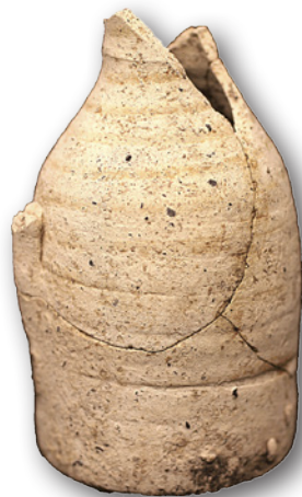
Bouteille. IXe siècle

réutilisèrent les mêmes espaces voutés. Ils laissèrent cependant aussi leur empreinte dans l'architecture des thermes par l'incorporation de nouvelles lucarnes à chaque extrémité des voutes afin de réguler l'ambiance salubre avec deux salles séparées, une pour les bains « hommes » et l'autre pour les bains « femmes ». A côté de la voute du bain « femmes » et sur les structures romaines ont été récupérées les premières sépultures du cimetière arabe (maqbara) d'Alhama de Murcia datant du XIIe et XIIIe siècle connus d'après les sources arabes comme Hamma bi-Laqwar. Le nom Alhama est un nom espagnolisé signifiant à l'origine « bain